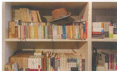
青山監督自邸の本棚 上2点『青山真治クロニクルズ』(リトルモア刊)より