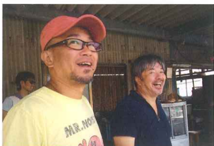
『共喰い』現場写真/青山真治監督と美術デザイナー清水剛

1964年7月13日、福岡県北九州市門司に生まれる。立教大学英米文学科卒。1996年『Helpless』で劇場映画監督デビュー。2000年『EUREKA』がカンヌ国際映画祭で国際批評家連盟賞とエキュメニク賞をW受賞。同作の小説版が三島由紀夫賞を受賞。2011年『東京公園』でロカルノ国際映画祭金豹賞審査員特別賞受賞。2015年度まで4年間、多摩美術大学映像演劇学科教授。2016年度、京都造形芸術大学(現・京都芸術大学)映画学科の学科長を務める。2022年3月21日逝去。