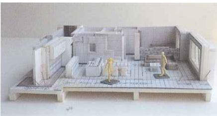
『空に住む』ロケセット模型