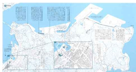
『映画監督・青山真治の地理学』(作成＝堀口徹)