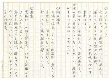
完成作とは内容が異なる『Helpless』直筆シナリオ